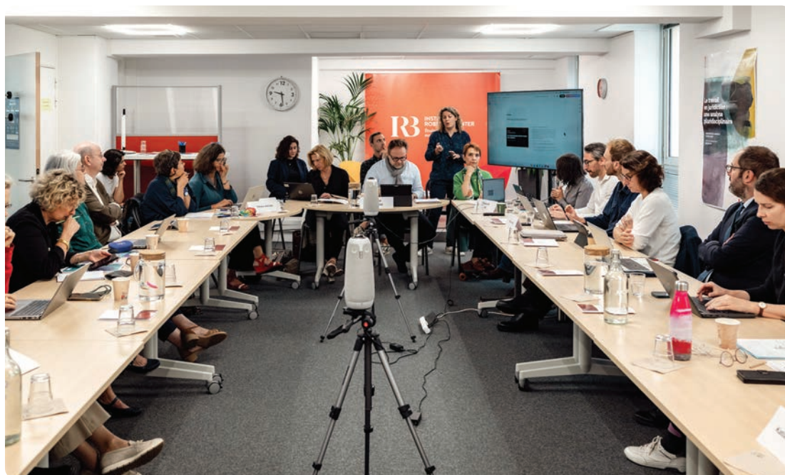
Vue de l'atelier n° 1 du 16 septembre 2025.

Pour ce faire, trois ateliers thématiques organisés en septembre, octobre et novembre 2025 les ont réunis autour de trois axes de réflexion. Le premier consacré au cadre de la notion de devoir de vigilance revient sur la généalogie du dispositif, qui s'inscrit dans une trajectoire au long cours, et examine ses spécificités et ses aspects innovants par rapport à d'autres dispositifs de conformité et d'alerte. Le deuxième traite des procédés de mise en œuvre des obligations de vigilance et s'efforce de cerner les attendus du plan de vigilance, d'envisager les méthodes pour élaborer une cartographie des risques et d'identifier les types de mesures requises, en mettant en valeur les bonnes pratiques. Le troisième porte sur la problématique de la supervision et du contrôle . Il aborde le contrôle de la conformité du devoir de vigilance par les autorités judiciaire et administrative, la réparation des dommages causés par la violation du devoir de vigilance et les modes alternatifs de règlement des différends qu'il examine en faisant un focus sur la médiation. ■