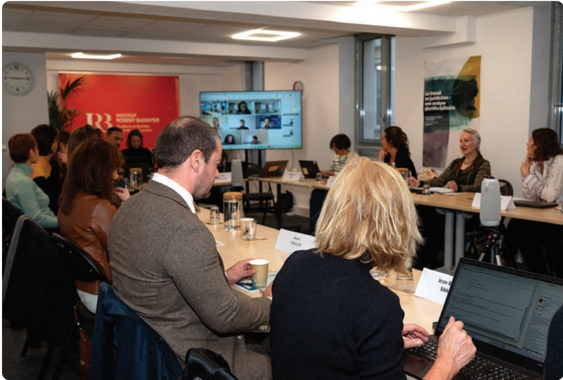
Vue de l'atelier n° 3 du 21 novembre 2025.