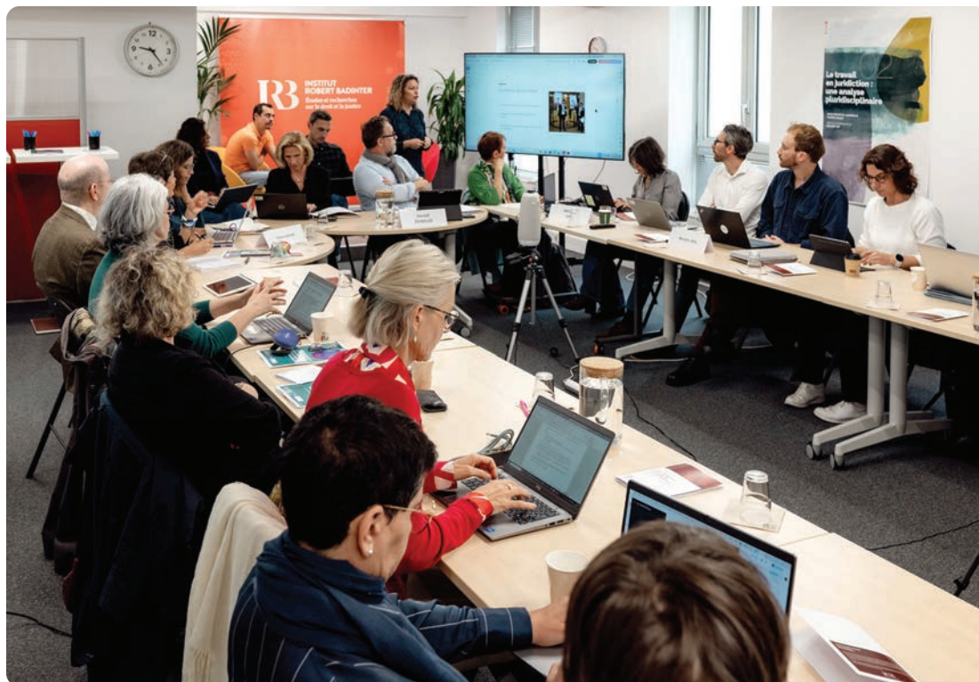
Vue de l'atelier n° 1 du 16 septembre 2025.