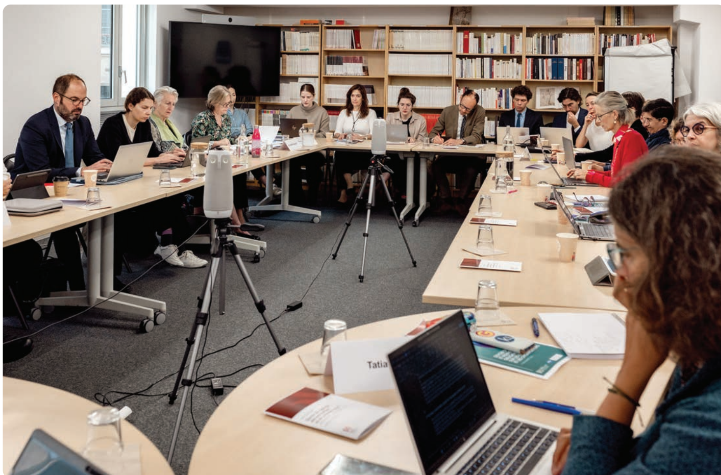
Vue de l'atelier n° 1 du 16 septembre 2025.

Par opposition, le reporting , tourné vers les marchés, ne permet pas une véritable interpellation interne sur la gouvernance. Il est perçu comme un outil de comparabilité des performances plutôt qu'un mécanisme de transformation. Pour que le devoir de vigilance soit pleinement effectif, il doit s'accompagner d'une obligation de justification, fondée sur des standards construits collectivement même s'ils peuvent être ensuite adaptés aux spécificités de chaque entreprise. ■