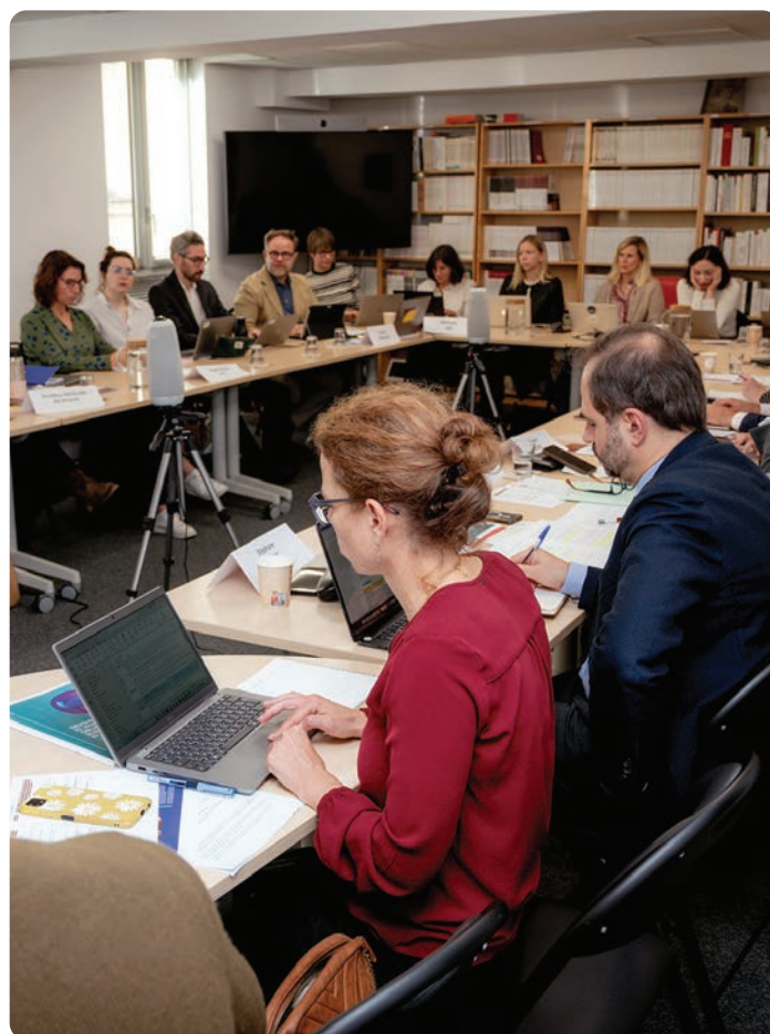
Vue de l'atelier n° 2 du 17 octobre 2025.

Un exemple notable d'outillage ressort de la loi californienne sur la transparence des chaînes d'approvisionnement ( California Transparency in Supply Chains Act ), qui a déclenché dans les années 2010 un élargissement du périmètre de vigilance au-delà du rang 1 dans certains groupes soumis au droit de cet État. Les outils d'alerte portés par des ONG ou des médias sont également intégrés dans les dispositifs de remédiation et de suivi.