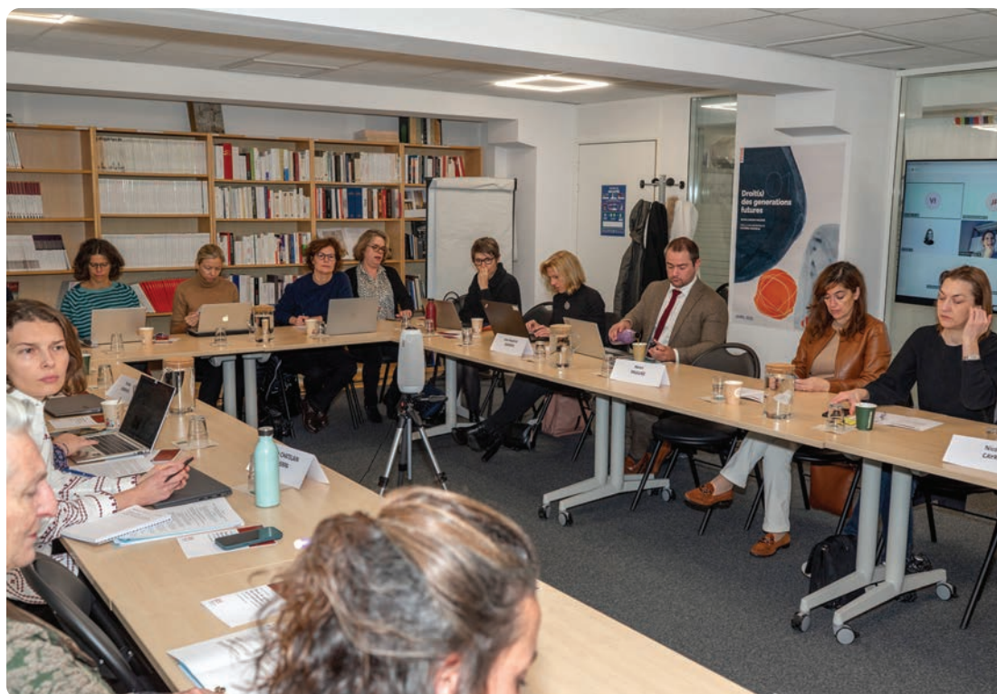
Vue de l'atelier n° 3 du 21 novembre 2025.

Dans le contentieux Yves Rocher, à titre d'illustration, l'omission des filiales dans la cartographie, bien que des organisations internationales aient signalé des discriminations en Turquie, pourrait conduire à admettre l'existence d'un lien de causalité et structurer l'argument en faveur de la réparation : cette omission a privé les personnes d'une détection et d'une remédiation qui auraient dû prévenir (ou réduire) le dommage, ouvrant la voie à des mesures en nature (cessation de pratiques, garanties d'égalité) et à des dommages-intérêts.