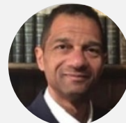
Manuel CARIUS , Magistrat, Vice-président de l'association française des magistrats pour la justice environnementale (AFMJE)