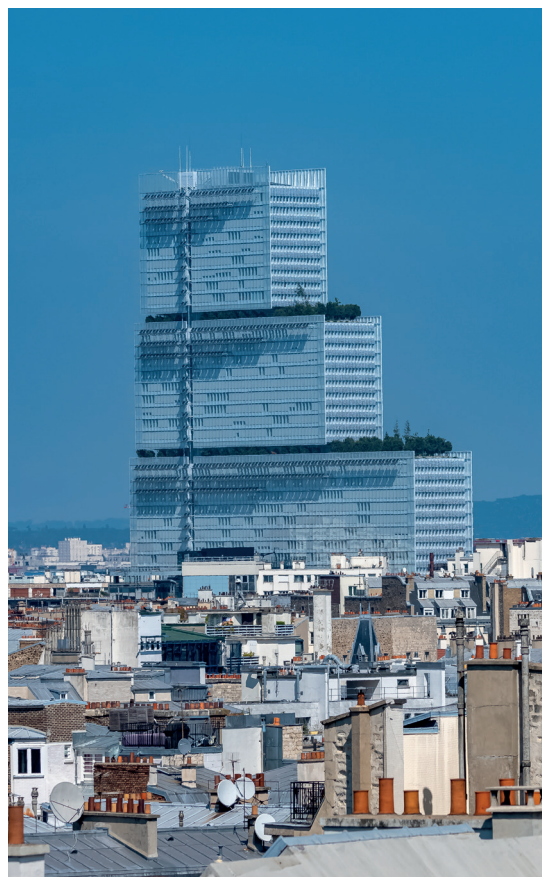
Le Tribunal de Paris.

Lorsque ce cadre comprend un certain nombre de réserves et de conditions, comme c'est le cas de la loi française, la compétence n'est pas absolue. Elle est alors parfois qualifiée de « quasi-universelle ».