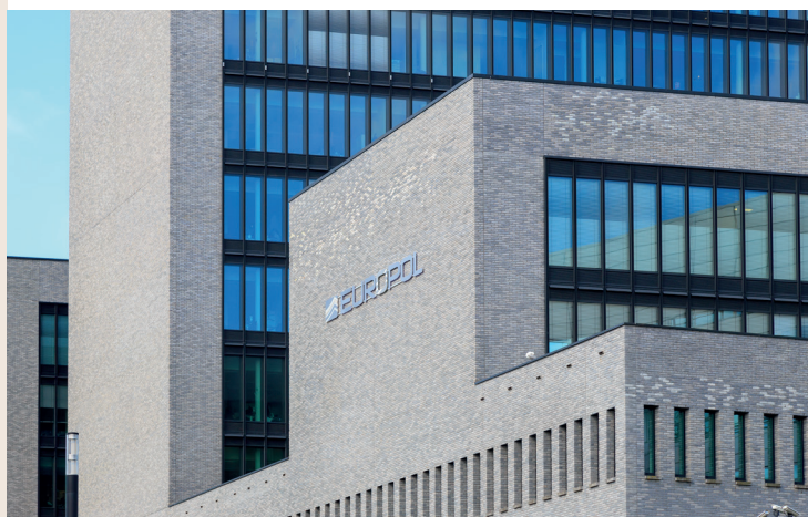
Bâtiments d'Europol, La Haye, Pays-Bas.

La mutualisation permet d'éviter aussi la multiplication des intervenants, les risques de confusion et les risques de traumatisme par la sursollicitation des victimes. Ainsi, un circuit coordonné (DSCG, parquets, OCLCH, PNAT) de recueil d'informations auprès des victimes présentes sur le territoire français a été très rapidement mis en place pour les réfugiés ukrainiens. La base de données constituée peut également être utile dans la collaboration de la France avec l'Ukraine et la CPI. Ce travail de collecte pourrait être amorcé en amont et élargi via Frontex et Europol. La mobilisation et les expériences autour de la situation ukrainienne offre un grand potentiel d'innovations et de réorganisations qui devraient être mises à profit pour d'autres situations à l'avenir.