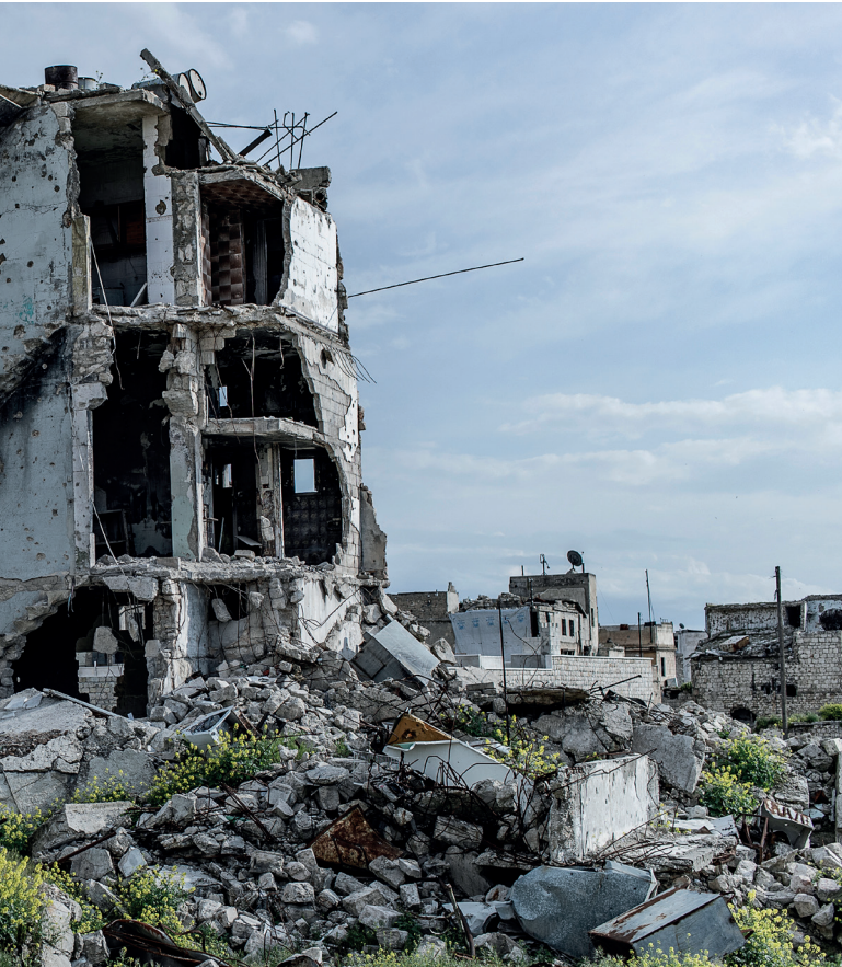
Bâtiment détruit, Alep, Syrie, 2019.

de la preuve, protection des témoins, soutien à des juridictions, etc.). Ne faudrait-il pas alors créer un mécanisme permanent avec un mandat plus général ? Un rapport avec différentes options a été présenté lors de la réunion du G7 en juin 2022 qui ouvre la voie dans cette direction 22 .