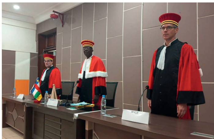
Les juges de la chambre d'appel de la Cour pénale spéciale de la République de Centrafrique, 15 février 2023.

prisons, et la formation de la police (pas seulement des magistrats).