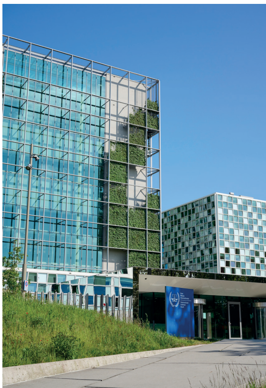
Siège de la Cour pénale internationale, La Haye, Pays-Bas.

De nombreuses questions se posent aussi par rapport à l'option prise par le procureur de la CPI d'intégrer l'enquête structurelle commune ouverte, sous l'égide d'Eurojust le 25 mars 2022, par l'Ukraine, la Pologne et la Lituanie. Dans une déclaration publique le procureur Karim Khan a avancé que « ce genre de partenariat montre que l'on peut changer la dynamique de coopération judiciaire – non seulement en Ukraine mais partout ailleurs. Les justices nationales ont des capacités importantes et peuvent permettre des procédures moins coûteuses et plus efficaces. Au lieu que La Haye soit la base de la justice pénale internationale, nous pouvons créer un front commun formé d'enquêteurs et de procureurs nationaux, de cours nationales et de la CPI, tout en préservant l'indépendance de chacune de ces institutions » ( Le Monde du 14 mai 2022).