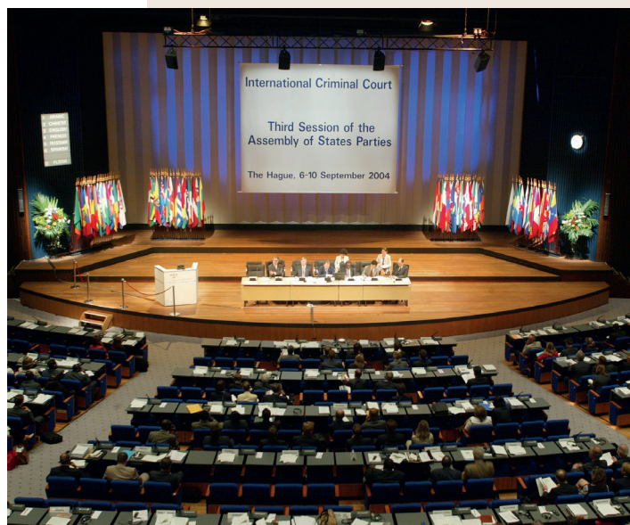
Troisième session de l'Assemblée des États parties au Statut de Rome de la Cour pénale internationale, La Haye, Pays-Bas, septembre 2004.

Le chapitre IX du Statut de Rome, article 86 à 102, est consacré à la coopération et à l'assistance judiciaire. Le principe de complémentarité est quant à lui affirmé dès le préambule du Statut et se décline dans plusieurs articles du chapitre II sur la compétence, la recevabilité et le droit applicable et du chapitre IX.