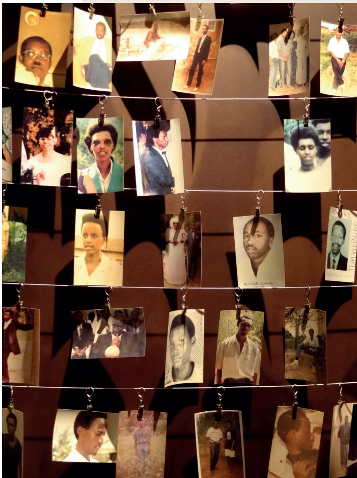
Photographies de victimes du génocide des Tutsis, mémorial du génocide de Kigali, Rwanda, avril-juillet 1994.

Les États de l'UE sont représentés au sein du réseau par des points de contact nationaux (procureurs, enquêteurs, officiers d'entraide judiciaire spécialisés...). Le secrétariat du Réseau génocide a été créé en 2011 et est hébergé par Eurojust. Ce réseau réunit ses membres deux fois par an afin de coordonner le travail en cours sur les enquêtes et poursuites des auteurs de crimes internationaux les plus graves.