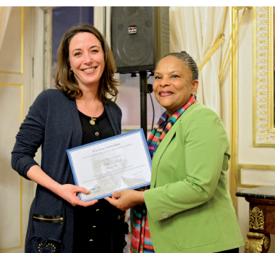
La lauréate, Pauline Abadie, et Christiane Taubira, Garde des Sceaux