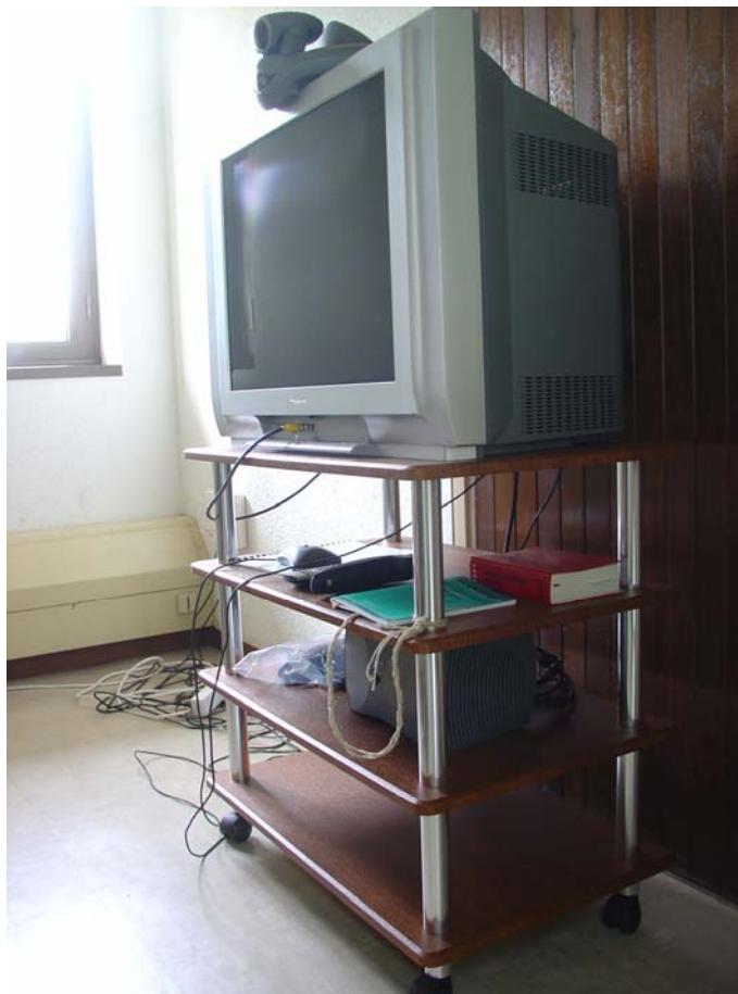
Figure 1 : Détail du dispositif de visioconférence du Tribunal de grande instance de Saint-Denis de la Réunion, novembre 2007.

objets nécessaires à la visioconférence sont disponibles sur le meuble de visio (voir figure 1). On note en effet que sur les tablettes se côtoient trois types d'objets : des objets technologiques permettant la connexion (la télécommande, le codec), un objet juridique (le code de procédure pénale) et un objet ad hoc : le cahier de visioconférence sur lequel sont listées les utilisations du dispositif (quand, par qui, avec quel site distant, pour quel type d'acte). La question des apprentissages et des passages de relais est cruciale dans l'institutionnalisation de l'innovation.