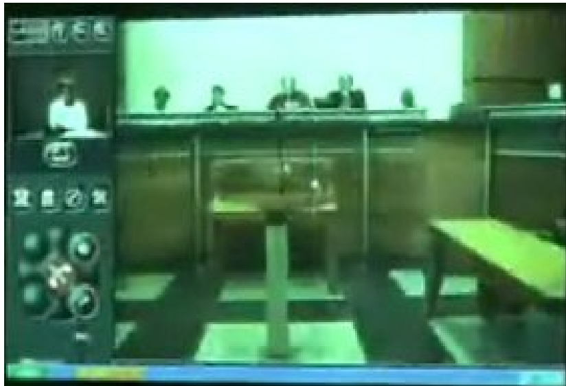
Figure 1 : Image à la connexion avec la Cour d'assises de Saint-Denis de la Réunion (voir séquence B)

alors qu'ils sont en train de siéger, lorsqu'ils souhaitent entendre le témoin ou l'expert distants. Cette méthode permet des formes de comparution à distance susceptibles de se faire en quelques tours et quelques secondes (bien que pour le témoin, l'écart soit très grand entre la situation d'attente informelle qui précède et leur témoignage proprement dit, dans le contexte très formel et solennel de la cour d'assises), comme dans l'exemple suivant.