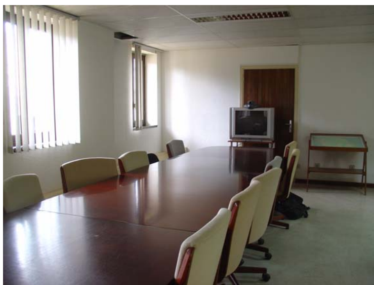
Figure 4 : Vue de la salle de visioconférence du Tribunal de grande instance de Saint-Denis de la Réunion, novembre 2007.