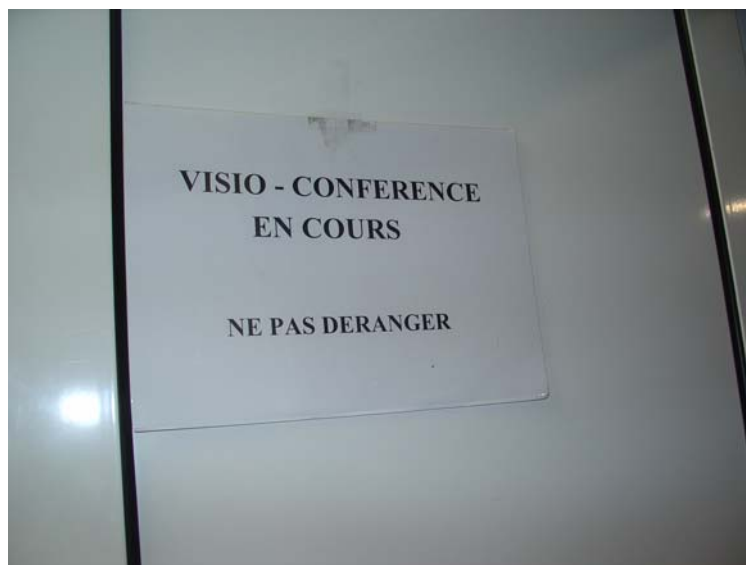
Figure 1 : Panneau apposé sur la porte de la salle de bibliothèque lorsque des visioconférences sont en cours, Tribunal de grande instance de Saint-Pierre de la Réunion, octobre 2007.

témoignage à distance de bénéficier d'une forme d'extraction des activités ordinaires, non juridictionnelles.