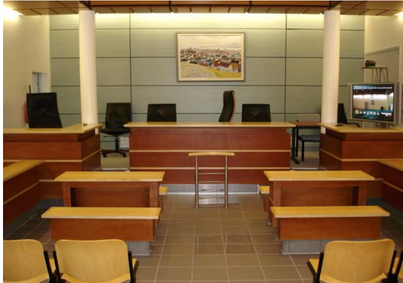
Figure 1 : Le prétoire de Saint-Pierre et Miquelon, vu du fond de la salle, près de l'entrée du public. Au premier plan, les chaises du public, puis les bancs des avocats et des parties, la barre. A gauche au fond le bureau du procureur. En face au fond celui du ou des juges. Enfin on notera à droite, face au bureau du procureur, le dispositif de visioconférence, installé de manière permanente dans la salle.

Avant l'entrée des juges, les membres de l'audience sont dispersés dans des engagements divers, mais leur position rend lisible l'activité à venir. En remplissant ce qui apparaît alors une position focale mais vide (le bureau surélevé au fond et au centre de la salle d'audience) l'entrée des juges vient compléter la scène. La paire d'actions que constituent l'acte de langage inaugural du président et l'alignement ostensible de l'attention et des actions du public anime un tableau, intelligible d'un seul coup d'œil comme une audience en prétoire, du fait de la disposition des participants dans un espace cadré et « préparé » pour cette activité.