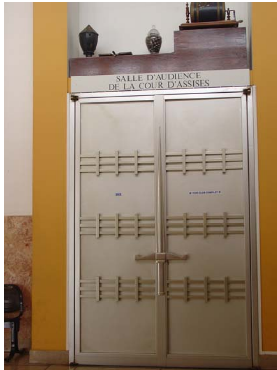
Figure 1 : La porte de la salle de la Cour d'assises de Saint-Denis de la Réunion, obturée par des portes métalliques lorsque le huis clos est prononcé. Au centre, un élément symbolique : le glaive de la justice.

La photographie ci-dessus montre bien l'impossibilité matérielle de rentrer dans la salle, un petit bandeau indiquant sur la porte de droite « Huis-clos complet » (voir figure 2). En outre, les hublots qui habituellement permettent de « jeter un œil » dans la salle sans y pénétrer, sont également obturés.