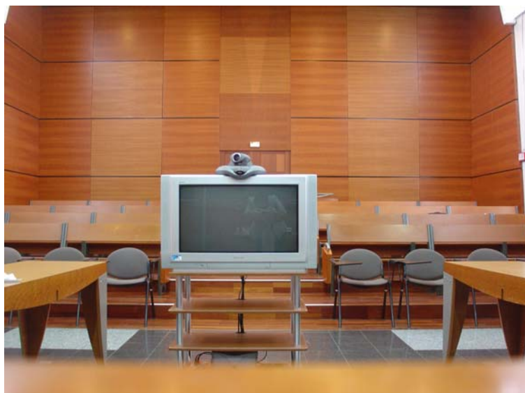
Figure 3 : La salle de la Cour d'assises de Saint-Denis de la Réunion, équipée d'un dispositif fixe de visioconférence. La vue est prise depuis la barre. A droite et à gauche, les tables des avocats, au fond les bancs du public.