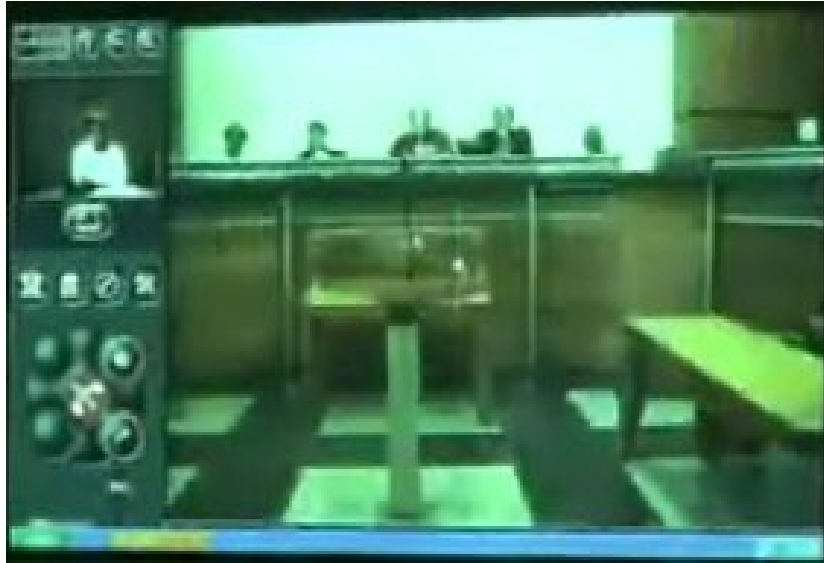
Figure 3 : Image à la connexion avec la Cour d'assises de Saint-Denis de la Réunion

Par ailleurs, la mise en relation avec un espace temps spécifique (le judiciaire) qui se distingue du monde des interactions ordinaires s'effectue aussi de façon plus brutale et abrupte pour celui qui se trouve sur le site distant, nous l'avons bien montré à la fin du chapitre 4.