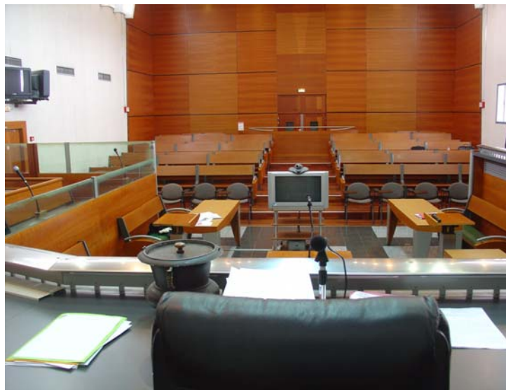
Figure 2 : La salle de la Cour d'assises de Saint-Denis de la Réunion, équipée d'un dispositif fixe de visioconférence. La vue est prise depuis le fauteuil du Président. Au centre, l'écran principal de visioconférence. A gauche, on aperçoit deux écrans 'secondaires' de télévision, l'un orienté vers les jurés, l'autre vers le public. Le même système est installé sur le côté de la salle.