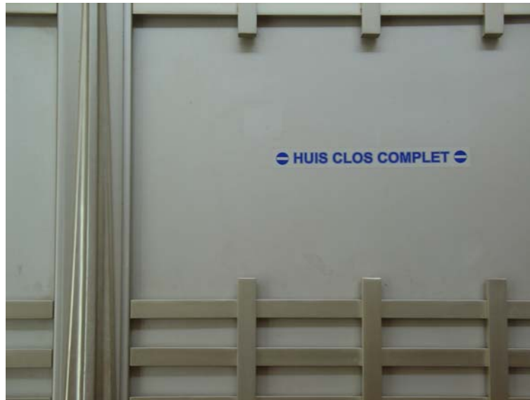
Figure 2 : Détail de la porte de la salle de la Cour d'assises de Saint-Denis de la Réunion, indiquant que le huis clos a été prononcé.

Les entretiens avec les experts et les débriefings que nous avons faits avec eux après leurs dépositions à distance confirment la différence d'expérience entre l'ici de la salle d'audience et le là-bas de la salle distante. Ils relèvent notamment la difficulté accrue à interpréter la situation de l'interaction : faute de plan large, ils ne voient pas l'ensemble du tribunal et ne savent pas toujours à qui ils ont exactement affaire, qui est là, qui parle, s'il y a ou non du public. Ils sont non seulement coupés de la vie de l'audience mais aussi privés d'un certain nombre d'éléments habituellement disponibles pour identifier ses interlocuteurs (le cadre) et engager une interaction. Ainsi dans l'image ci-dessous (voir figure 3), nous voyons ce que voit le témoin qui est mis en connexion avec la Cour d'assises de Saint-Denis : il a face à lui cinq personnes alors que le jury comporte douze membres, il aperçoit les trois magistrats professionnels qui sont en robe (le président au centre et à droite et à gauche, ses deux assesseurs) et ne voit que deux jurés. L'avocat général, les avocats, le public sont hors cadre et donc invisibles pour le témoin qui n'a pas idée de qui est dans la salle.