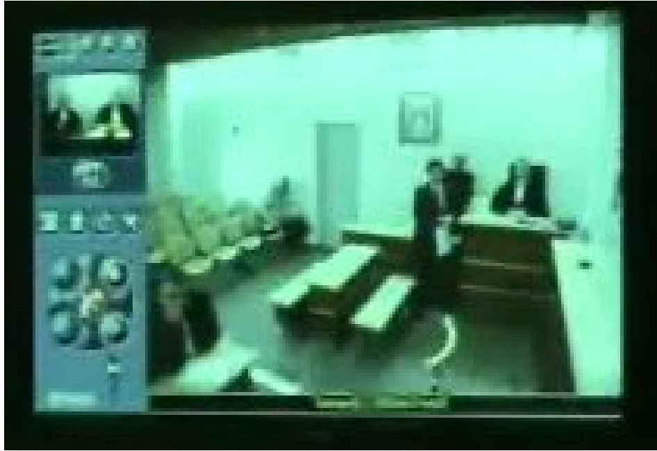
Figure 3 : Image visible du côté parisien à la connexion. Le procureur (en robe) est assis à droite, à sa place habituelle, avec le greffier du tribunal de Saint-Pierre et Miquelon qui se tient debout à sa gauche. Devant eux, debout, le président du Tribunal Supérieur d'Appel (qui ne joue pas de rôle dans l'audience à venir En dehors du fait qu'il s'agit d'une audience de la juridiction qu'il préside). Assis au fond de la première rangée de sièges, la personne dont l'affaire est sur le point d'être traitée. En bas à gauche, un avocat (en robe) qui représente des « témoins assistés » et absents. Dans l'image de contrôle, en haut à gauche, le président et le greffier parisiens. La qualité de l'image présentée ici a été dégradée par rapport à celle effectivement visible à l'écran, pour des raisons de confidentialité.

Certaines audiences à distance décalquent presque à l'identique l'organisation séquentielle de la séquence canonique d'ouverture de l'audience en prétoire. Cela arrive pour des audiences de première instance, dans des affaires présidées par un juge unique. Tout le tribunal siège à Saint-Pierre-et-Miquelon, à l'exception d'un avocat qui se connecte de Paris. Dans ce cas, l'ouverture de l'audience se fait selon une séquence du type :