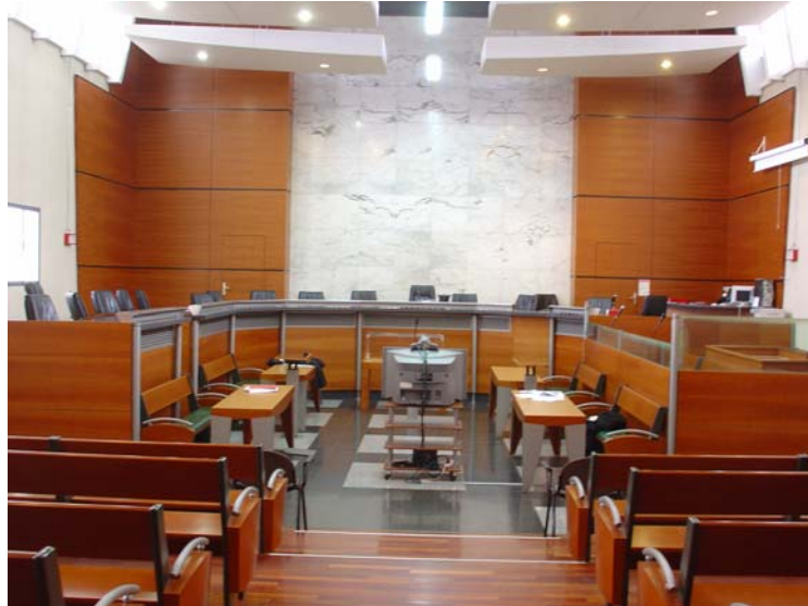
Figure 1 : La salle de la Cour d'assises de Saint-Denis de la Réunion, équipée d'un dispositif fixe de visioconférence. La vue est prise depuis le fond de la salle.