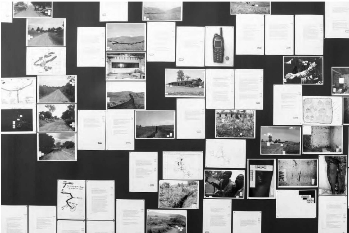
Muzungu de Franck Leibovici et Julien Seroussi (salle 5)

Juger, l'installation muzungu de Franck Leibovici et Julien Seroussi (salle 5 de l'exposition), nous en montre toute la complexité. Rares sont les œuvres qui nous font entrer ainsi au cœur même d'un procès qui s'est tenu à la CPI, en l'espèce celui de l'attaque d'un petit village de République démocratique du Congo – Bogoro – le 24 février 2003 par les milices des deux accusés, Germain Katanga et Mathieu Ngudjolo. Le premier sera condamné pour complicité de crimes contre l'humanité, le second acquitté.