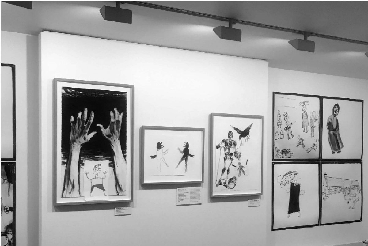
Déflagrations, Z.S. Girardeau (salle 4)

leurs souffrances mais aussi le sens même de ce qui justifie la création de la CPI.