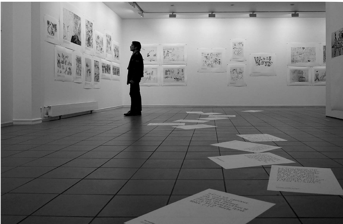
Déflagrations, Z.S. Girardeau (salle