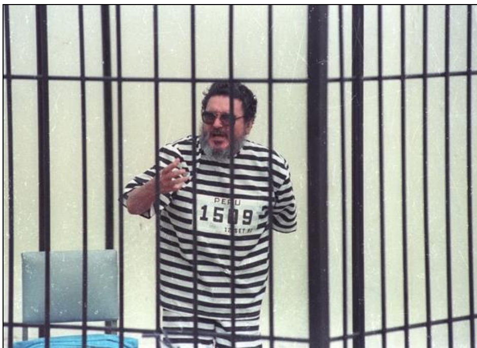
Photo 3 : Abimael Guzmán présenté à la presse après sa capture, septembre 1992