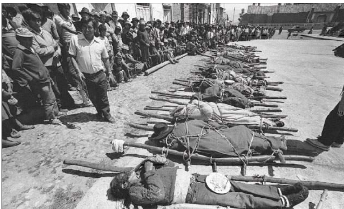
Photo 7 : Massacre de 62 paysans à Accamarca par les militaires, le 14 août 1985

• Les sociétés civiles ont répondu différemment, selon le degré de participation et d'identification avec les victimes des conflits, aux attaques subversives et aux répressions étatiques. Par exemple, en Argentine et au Chili, les sociétés ont réagi en totale solidarité avec les victimes de la répression des forces armées, ce qui se comprend bien dans la mesure où les classes moyennes et pauvres avaient été la cible des violences étatiques. En revanche, dans les pays où la majorité des victimes étaient des groupes exclus, notamment des peuples originaires, comme au Guatemala et au Pérou, la solidarité de la société civile hispanophone, éduquée et non concernée directement par la violence, a été très restreinte.