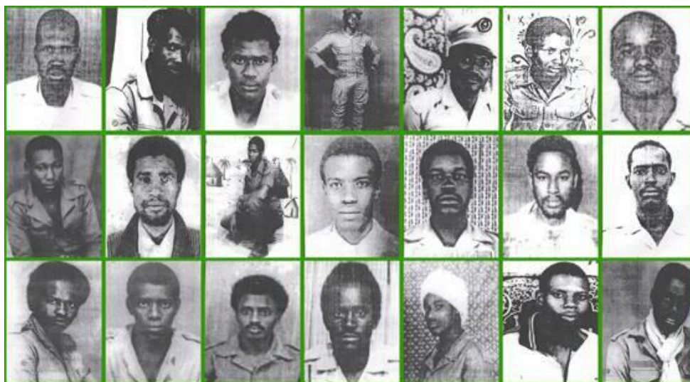
Photo 9 : Le 28 novembre 1990, 21 des 28 militaires Haalpulaar'en qui furent pendus à la Base d'Inal