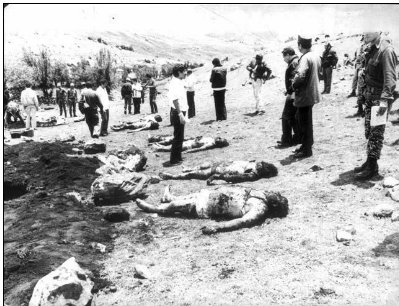
Photo 1 : Massacre d'Uchuraccay, 1983 (8 journalistes tués par les paysans Quechua qui croyaient qu'ils appartenaient au PCP-SL) (©Archives La República , Villasante 2016)

En 1980, le Pérou venait de commencer une période de gouvernement civil après 12 ans de dictature militaire (1968-1979). Le nouveau gouvernement du président Fernando Belaunde assumait le pouvoir sans juger indispensable la mise en place d'un gouvernement de transition qui fasse toute la lumière sur la sombre période militaire. Il ne remet pas en question les nombreux privilèges instaurés par les deux gouvernements des généraux Velasco (1968-1975) et Bermudez (1975-1979) ; ni leurs responsabilités dans les cas de violences à l'encontre des civils accusés de « dissidence ». Certes, la dictature péruvienne ne peut pas se comparer à celles, bien plus sanguinaires, du Chili et de l'Argentine. Mais de nombreuses violations des droits humains et des droits civiques avaient été commises, notamment au cours des années 1977-1979, marquées par un grand mouvement social à l'encontre de la dictature.