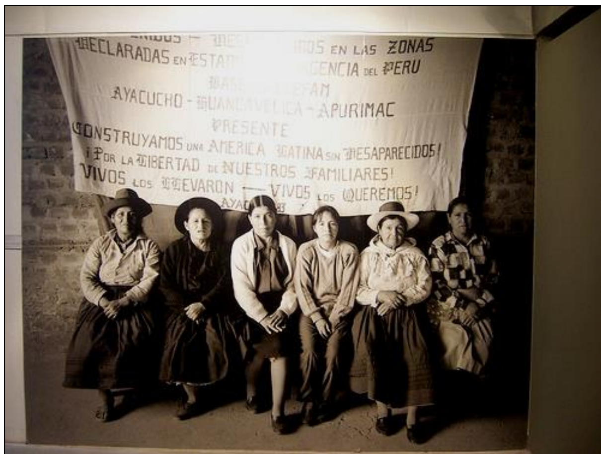
Photo 8 : Association de victimes d'Ayacucho

• Les associations des victimes péruviennes reçoivent l'aide des organisations de défense des droits humains, mais leurs voix ne sont pas entendues sur le plan national car la société civile s'avère incapable de se solidariser avec leurs causes. Or, les blocages étatiques et sociaux freinent la mise en application des recommandations de la CVR, et cette situation s'explique en Amérique latine par le maintien des mentalités et des structures sociales hiérarchiques, autoritaires et racistes qui méprisent les pauvres et les indigènes. Ce qui peut nous conduire à considérer que la justice de transition peut se concrétiser seulement dans des sociétés qui ont adopté les valeurs occidentales d'égalité sociale et de justice pour tous.