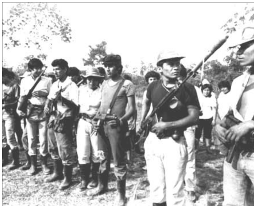
Photo 2 : Senderistes au Huallaga (Amazonie nord, zone de trafic de cocaïne) 1995

L'armée changea sa politique après 1989, sans abandonner ses méthodes de destruction des terroristes réels ou innocents : tortures, exécutions, massacres. Les milices civiles commencèrent à s'organiser à partir de 1983, et reçurent un soutien officiel en 1985, puis en 1991 (armes, munitions, formation militaire). Une partie des subversifs passa dans les rangs des milices pro-étatiques, bénéficiant de la Loi de repentance de 1992 (dérogée en novembre 1994). Les miliciens ont eu un rôle central dans l'anéantissement du PCP-SL, mais ils ont été aussi responsables de graves violences contre des civils désarmés. Leurs actions montrent l'ambivalence de tous les civils qui prennent les armes dans des guerres civiles. En 2003, on estimait leur nombre à 500 000 hommes armés et organisés au sein d'environ 8 000 milices [ rondas campesinas y nativas ]. Ils n'ont pas été désarmés et dans la région de l'Amazonie centrale où se sont installés des narco-terroristes (vallée des fleuves Apurímac, Ene et Mantaro, VRAEM), ils reçoivent des munitions de l'armée.