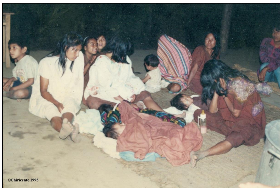
Photo 12 : Rescapés Ashaninka des camps senderistes à Matereni (Junín) 1995