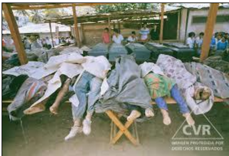
Photo 4 : Massacre de Tsiriari par le PCP-SL, août 1993 (72 morts)

paramilitaires » (milices civiles et commandos de la mort étatiques). Il s'agissait : (a) d'analyser les conditions qui ont contribué à la violence, (b) d'éclaircir à travers les instances de justice les crimes et les violations des droits humains et identifier les victimes et les responsables, (c) d'élaborer des propositions de réparation aux victimes et à leurs proches, (d) de recommander des réformes institutionnelles, légales, éducatives et autres comme garanties de prévention, et (e) d'établir des mécanismes de suivi des recommandations. En un mot, il fallait expliquer les causes du conflit, examiner les séquelles à travers des réparations aux victimes et des réformes institutionnelles.