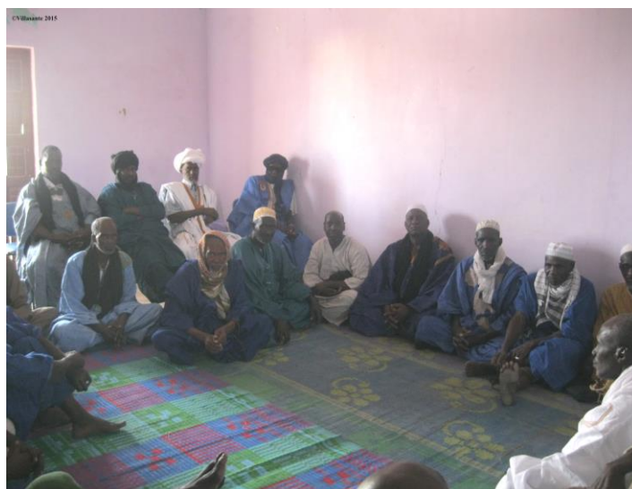
Photo 11 : Réunion du Collectif des victimes de la répression militaire (COVIRE), Nouakchott, avril 2015